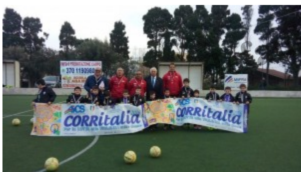
Scuola calcio Aga Messina

Ha riscosso, anche quest’anno, unanimi consensi la “ Settimana dello Sport per tutti 2016 ” dell’ AICS Messina . Le numerose attività previste si sono susseguite, infatti, per sette giorni nella città dello Stretto, unendo la contagiosa voglia di stare insieme alla sana pratica dell’attività sportiva.