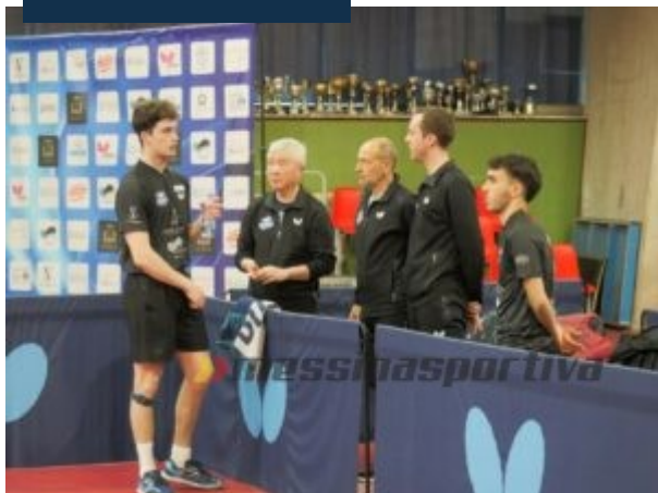
Time out

consecutivi messi a segno dal mantovano e primo singolare della serie, tra gli altri dalla Top Spin.