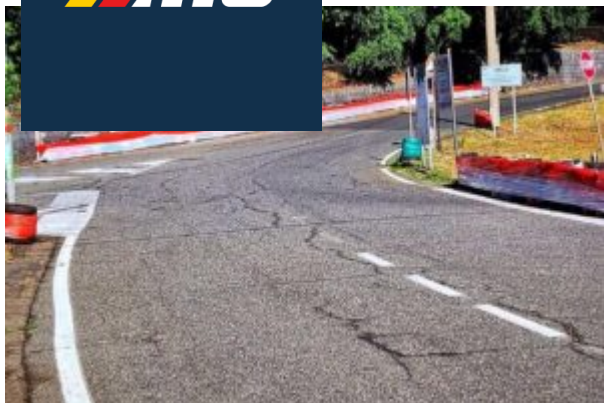
Il percorso della Giarre-Montesalice-Vivo