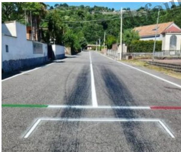
La piazzola di partenza della gara a Giarre