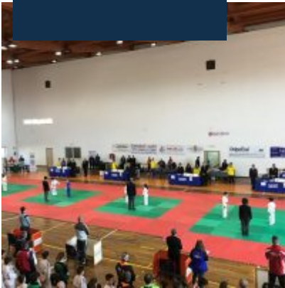
Una fase della gara