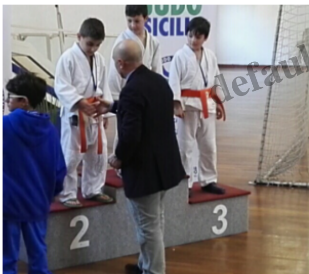
La premiazione dei giovani judoka

Domenica 19 marzo al PalaNebiolo si è svolto il Memorial Franco Costa , torneo di judo giunto all'undicesima edizione.