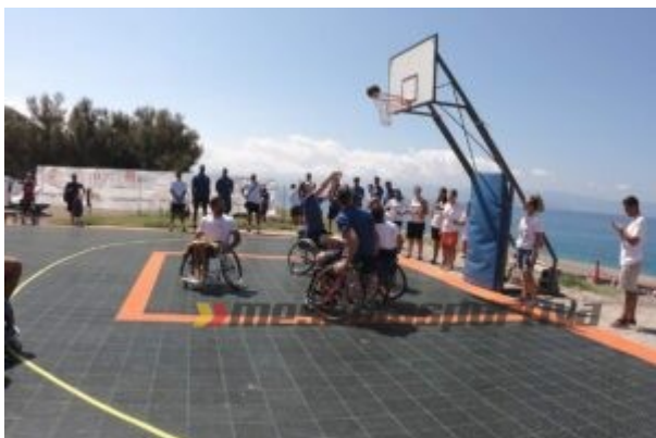
L'Allinparty andato in scena a Milazzo nel 2018