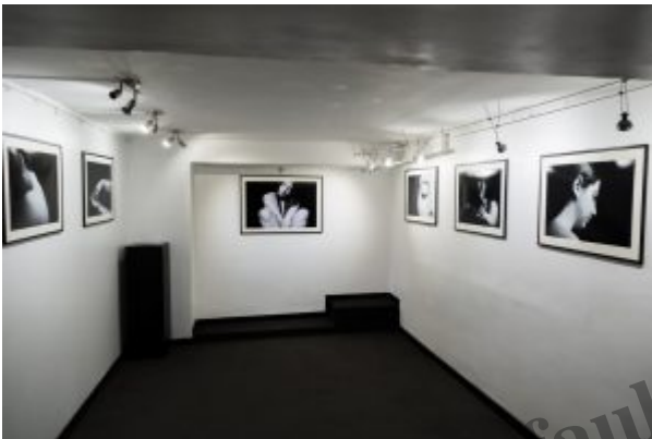
La splendida location dello studio d'arte Kalòs