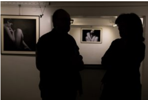
Alcuni ospiti accorsi nei locali di via Carlo Botta, 2